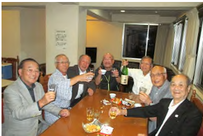
2次会は各県の人たちで盛り上り