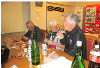
2次会は各県の人たちで盛り上り