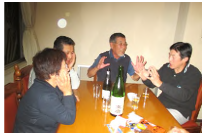
2次会は各県の人たちで盛り上り