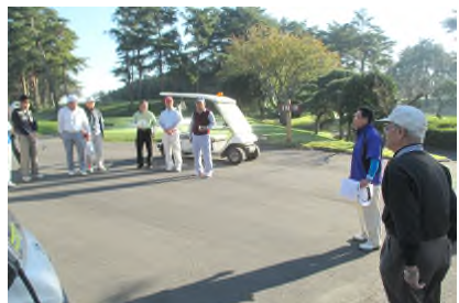
16日 開会式 快晴