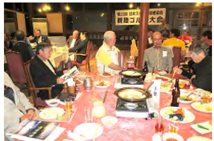
各県報告 千葉奥住会長