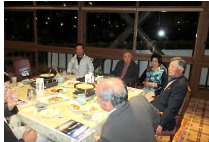
和気あいあいの懇親風景