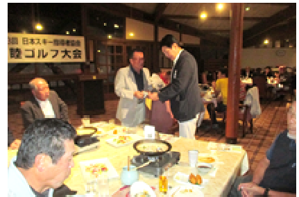
和気あいあいの懇親風景