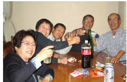
2次会は各県の人たちで盛り上り