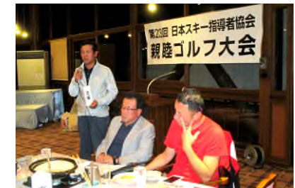
各県報告 宮城保原副会長