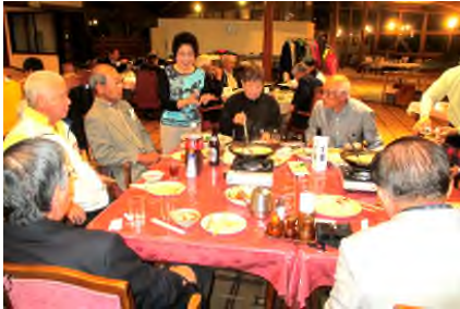
和気あいあいの懇親風景