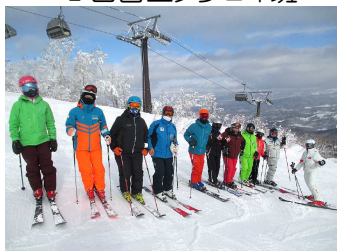
2日目エンジョイ班